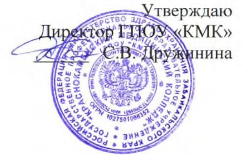
График промежуточной аттестации (экзаменов) в период летней сессии 2017 – 2018 учебного года

Акушерское дело базовая подготовка очная форма обучения специальность