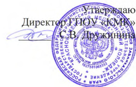
График промежуточной аттестации (экзаменов) в период летней сессии 2017 – 2018 учебного года

Лечебное дело углубленная подготовка очная форма обучения специальность