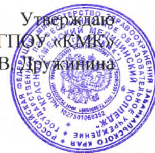
График промежуточной аттестации (экзаменов) в период летней сессии 2017 – 2018 учебного года

Сестринское дело базовая подготовка очная форма обучения специальность