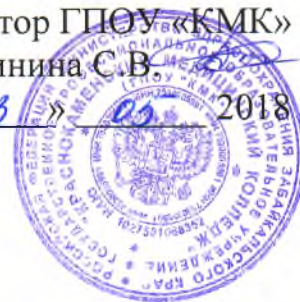
График Государственной итоговой аттестации на 2017 – 2018 учебный год специальность 31.02.02 Акушерское дело базовая подготовка очная форма обучения