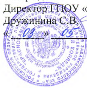
График государственной итоговой аттестации на 2017 – 2018 учебный год специальность 34.02.01 Сестринское дело базовая подготовка очно-заочная форма обучения