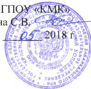
График Государственной итоговой аттестации на 2017 – 2018 учебный год специальность 31.01.01 Лечебное дело углубленная подготовка очная форма обучения