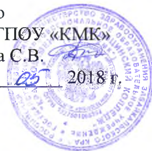
График государственной итоговой аттестации на 2017 – 2018 учебный год специальность 34.02.01 Сестринское дело базовая подготовка очная форма обучения